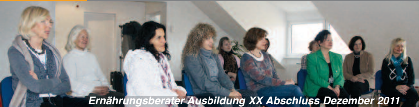
Ernährungsberater Ausbildung XX Abschluss Dezember 2011