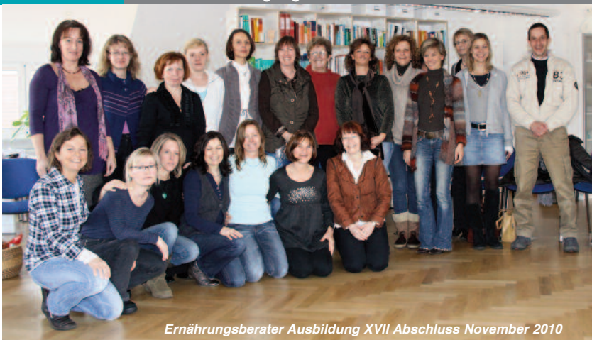
Ernährungsberater Ausbildung XVII Abschluss November 2010