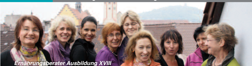
Ernährungsberater Ausbildung XVIII